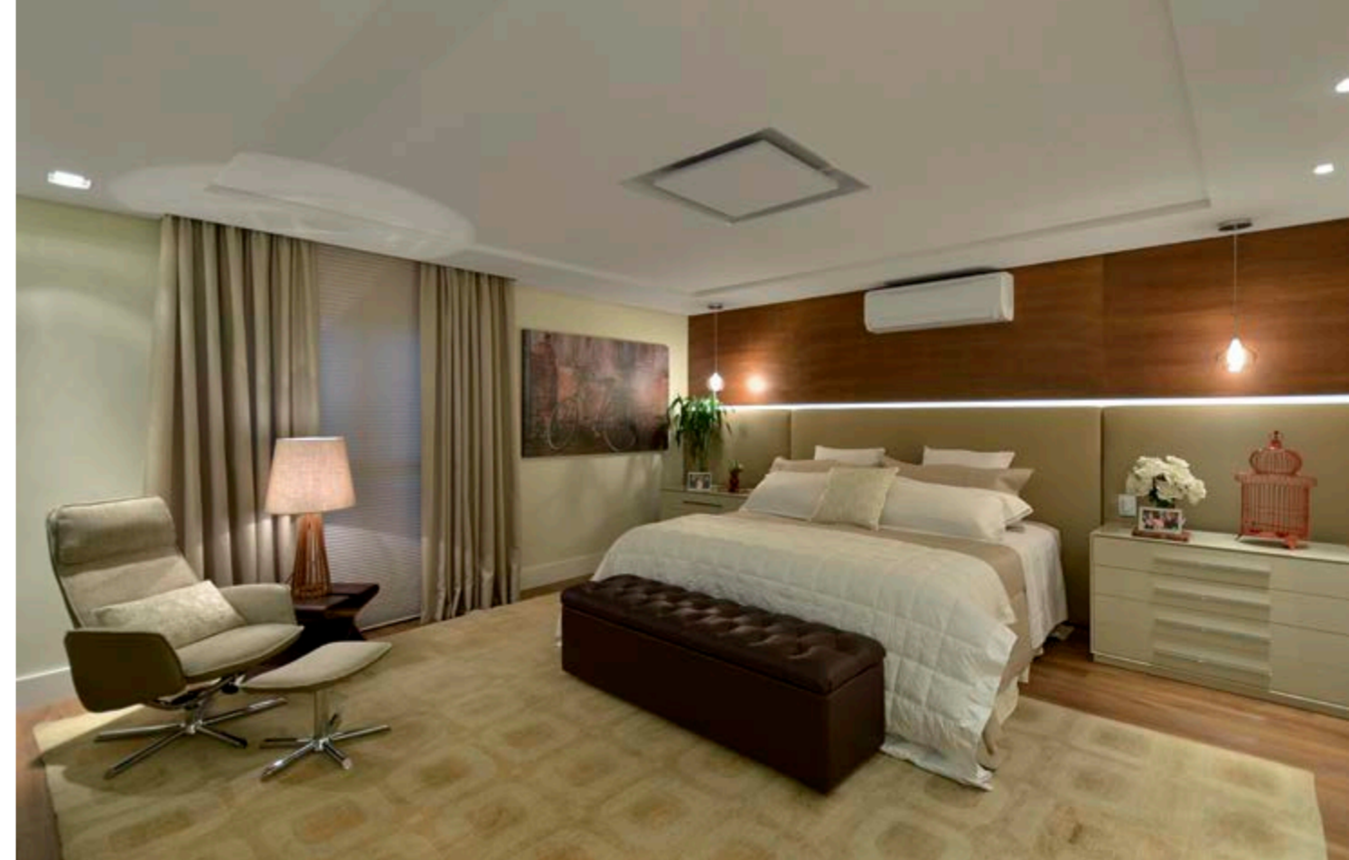
Na suíte, os beges substituem os cinzas para ampliar o efeito visual de conforto, como visto na laca fendi. A base é o tapete oriental tipo Safed Shore, de 4m x 5m, e visual estonado, produzido por uma técnica de tingimento, lavagem e raspagem. Nos tecidos, a versão sintética chamada de sede design da cabeceira é combinada ao reposteiro de shantung, que ladeia a persiana tipo celular com 38mm. Aos pés do leito, baú de couro com capitonê. Piso vinílico padrão Louro Itaúba.