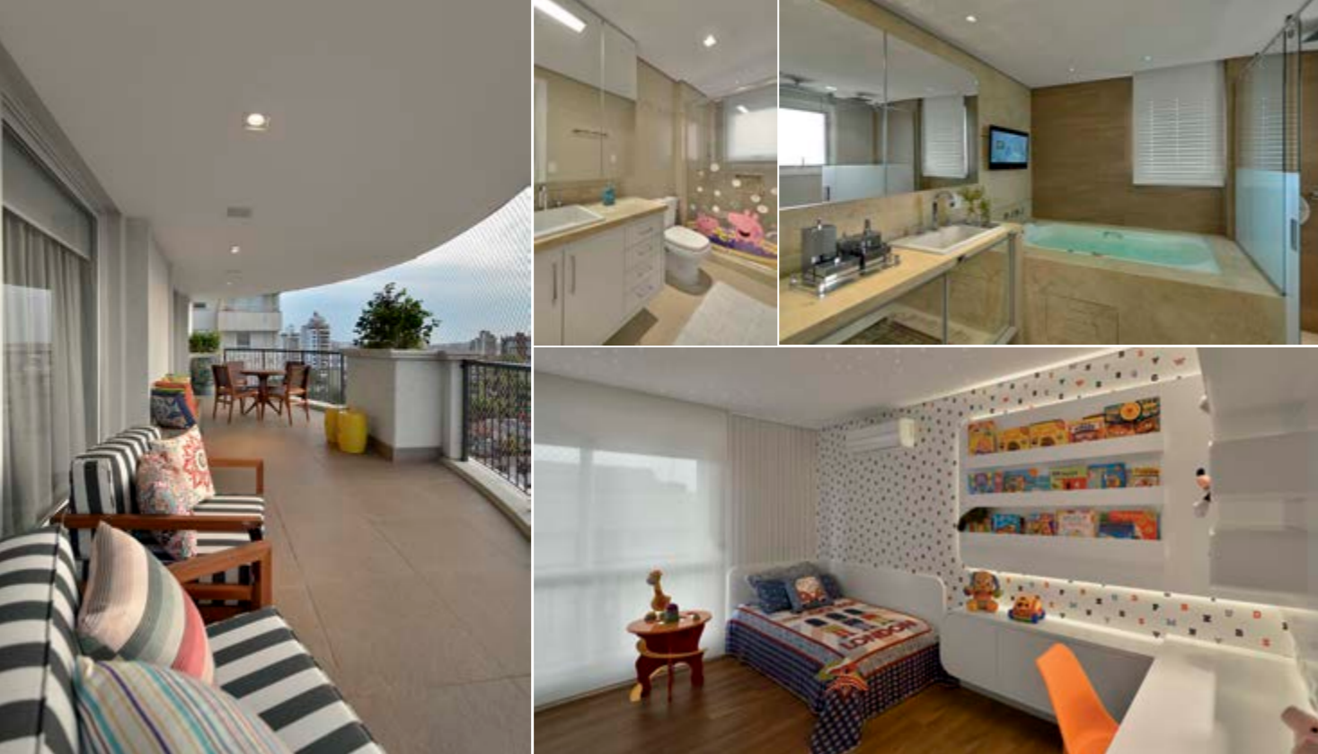
Madeira maciça com tratamento para áreas externas e tecido impermeável garantem o visual dos móveis da sacada. Acima, nos banheiros, a marcenaria em laca branca e bege predomina, assim como mármore neutros, a exemplo do travertino no banheiro dos filhos, e do crema marfil, na suíte. Neste, a parede ainda é destacada por porcelanato que imita madeira. No quarto do filho, piso vinílico garante fácil manutenção, e formas arredondas previnem acidentes. Leds imitam um céu de estrelas.